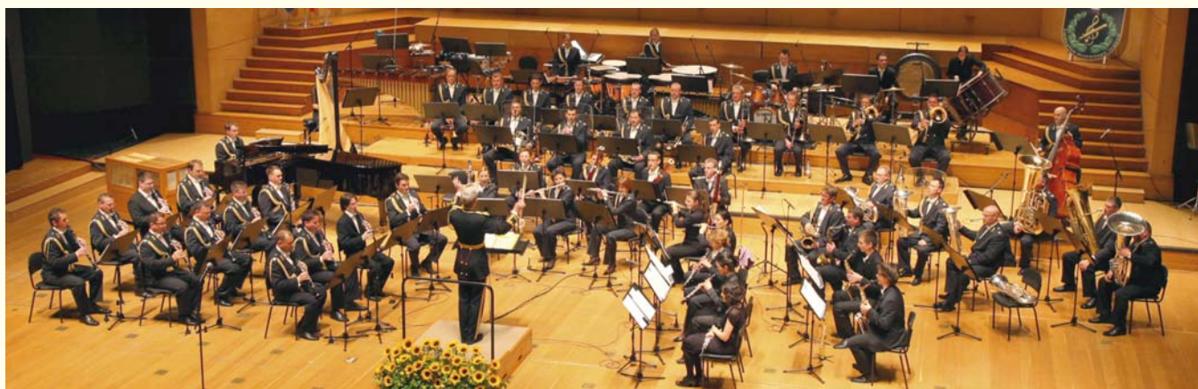
V vojašnici Petra Petriča bo v ponedeljek, 21. marca ob 18. uri, koncert Orkestra Slovenske vojske.

Krajevna skupnost Vodovodni stolp praznuje 21. marca v spomin na dogodke med drugo svetovno vojno v Šorlijevem mlinu.