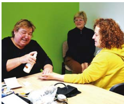
Vsake tri mesece so meritve. Lani se jih je udeležilo 134 krajanov.