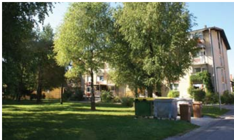
Šorlijevo naselje bo nekakšen »poskusni zajček«

Odgovor je, da smo bili julija in avgusta nekako zavrti zaradi dopustov. Poziv, da se Mestna občina Kranj (MOK) aktivno vključi v projekt, je bil najprej zavrnjen (ker, da MOK še nima izdelanega stališča). Kasneje smo dobili informacijo, da so se v Uradu za prostor in okolje aktivno lotili reševanja projekta in