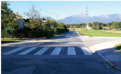
Upamo na sporazumno rešitev, saj bi bilo iskanje odgovora za krajanje kdo nasprotuje, preveč duhamorno.

»Po informacijah načelnika urada za prostor in okolje je projekt