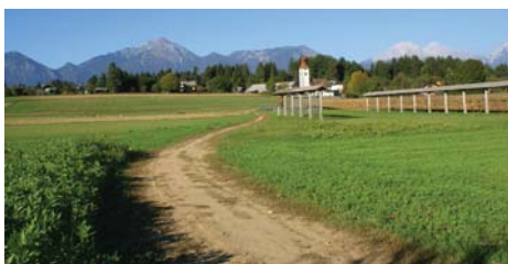
Morda pa tokrat vendarle ne bodo le obljube in izgovori.

»Prizadevamo si za nasutje poljske poti Švabska vas - Rupa (cerkev). Ta pot je začasna rešitev oziroma omilitev pešcem, da se izognejo nevarni cesti Švabska vas – Rupa. Cesto bi